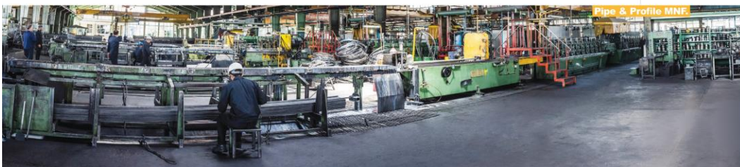
Pipe & Profile MNF.