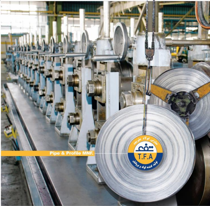
Pipe & Profile M.N.F.