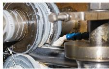
ایجاد مطابق استاندارد V3347 (تجدید نظر اول 1394)