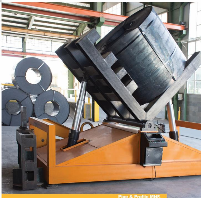
Pipe & Profile MNF.